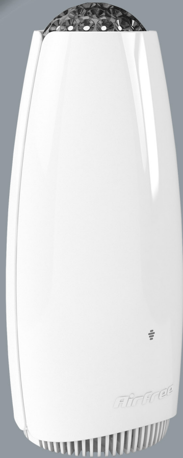
Airfree® Tulip 4000